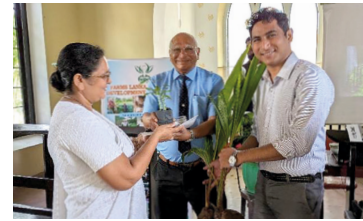
Die Teilnehmer der Schulungen erhalten Pflanzen, Saatgut und Dünger.

Christen in Sri Lanka, besonders diejenigen mit buddhistischem oder hinduistischem Hintergrund, stehen unter starkem Druck. Seit über 50 Jahren unterstützt unser Projektpartner vor Ort in Zusammenarbeit mit lokalen Gemeinden bedrängte Christen dabei, aus Isolation und Perspektivlosigkeit herauszufinden. Durch Schulungen in handwerklichen und landwirtschaftlichen Fähigkeiten, Kleinkredite und Kinderprogramme erhalten die Familien neue Zukunftsperspektiven.