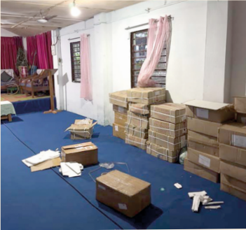
Unser Partner vor Ort lagert und verteilt Bibeln in der Region.

In einem buddhistischen Himalaya-Königreich lebt eine kleine christliche Minderheit unter starkem Druck und trifft sich heimlich. Unser Projektpartner unterstützt sie, in dem er Leiter ausbildet und biblische Schulungen anbietet.