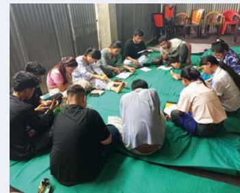
Angehende Gemeindeleiter in der Bibelschule studieren gemeinsam die Bibel.

In Nepal kann Evangelisation mit bis zu fünf Jahren Haft bestraft werden. Wer sich zu Jesus bekennt, wird oft von Familie und Gesellschaft ausgegrenzt. Besonders in ländlichen Gebieten kann der Widerstand sogar in Gewalt umschlagen. Dennoch wächst die christliche Gemeinde seit Jahren.