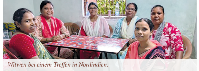
Witwen bei einem Treffen in Nordindien.

Durch den hindu-nationalistischen Kurs von Premierminister Narendra Modi fühlen sich radikale Gruppen bestärkt, Christen immer wieder anzugreifen, insbesondere Pastoren und Missionare. Diejenigen, die Jesus treu bleiben und getötet werden, hinterlassen oft Frauen und Kinder, die plötzlich ohne Ernährer dastehen.