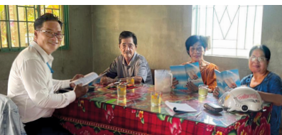
Unser Projektpartner betet gemeinsam mit einer Gruppe von Frauen für die Christen in Vietnam.

Wer in Vietnam missionarisch unterwegs ist und ins Visier der Behörden gerät, muss damit rechnen, im Gefängnis zu landen. Aber auch nach ihrer Freilassung bleibt es für viele Christen herausfordernd, denn es ist sehr schwierig für sie, eine Arbeit zu bekommen.