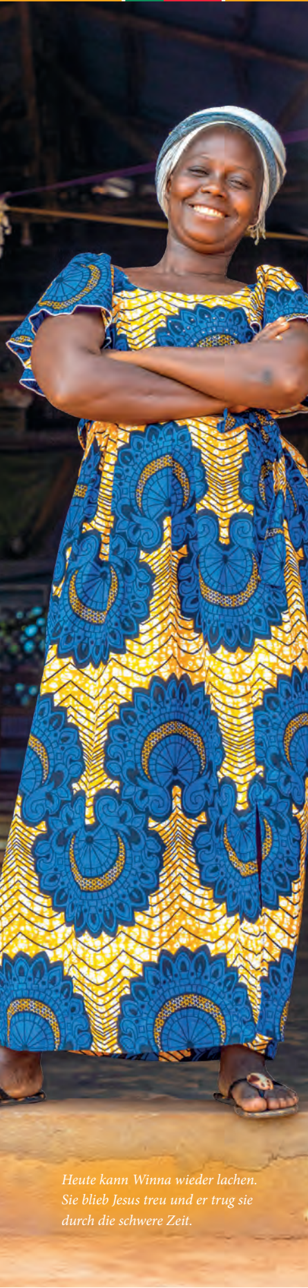
Heute kann Winna wieder lachen. Sie blieb Jesus treu und er trug sie durch die schwere Zeit.